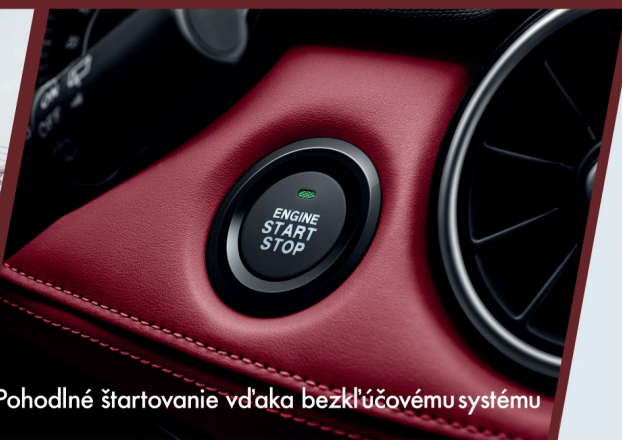
Pohodlné štartovanie vďaka bezklúčovému systému