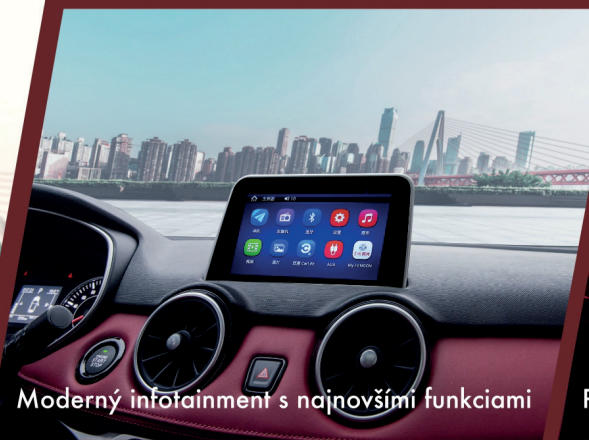
Moderný infotainment s najnovšími funkciami