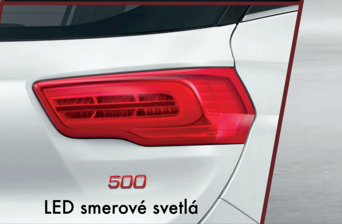
500 LED smerové svetlá