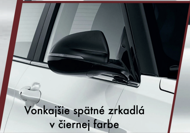
Vonkajšie spätné zrkadlá v čiernej farbe