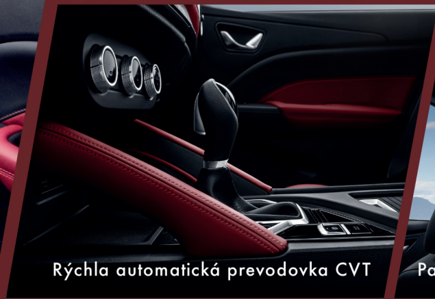
Rýchla automatická prevodovka CVT