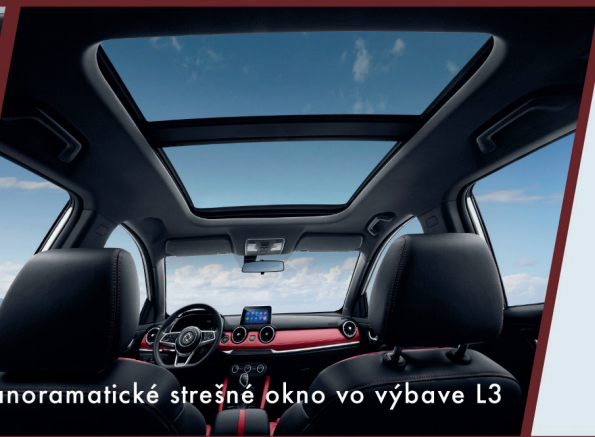
Panoramatické strešné okno vo výbave L3