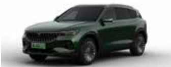
Dark green II