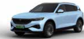
Cloud blue II