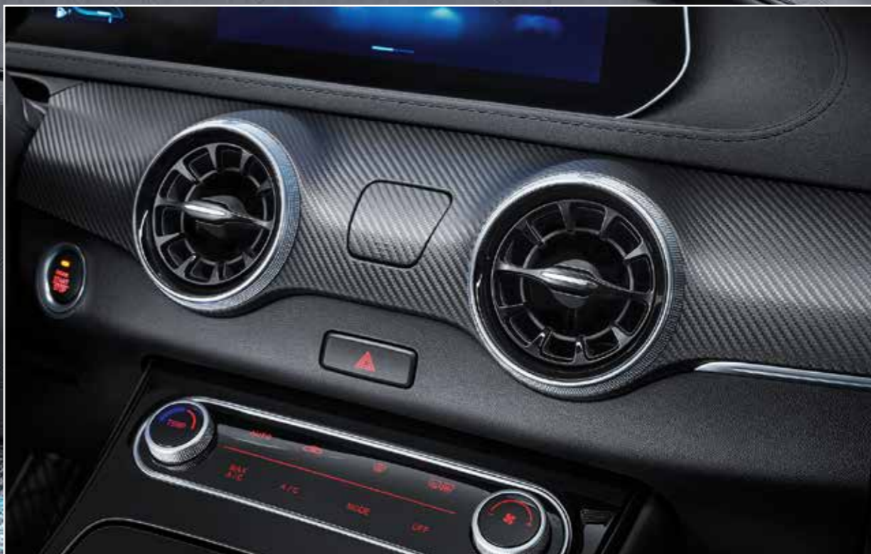
Vzor karbónu spolu s tmavým lakom na prístrojovej doske